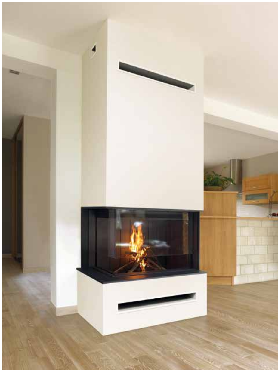
2 x S01809 + 2 x S09011