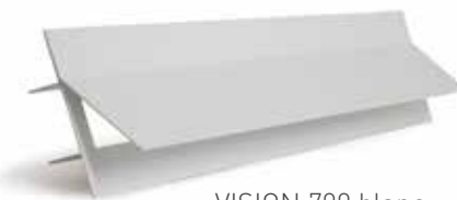
VISION 700 blanc