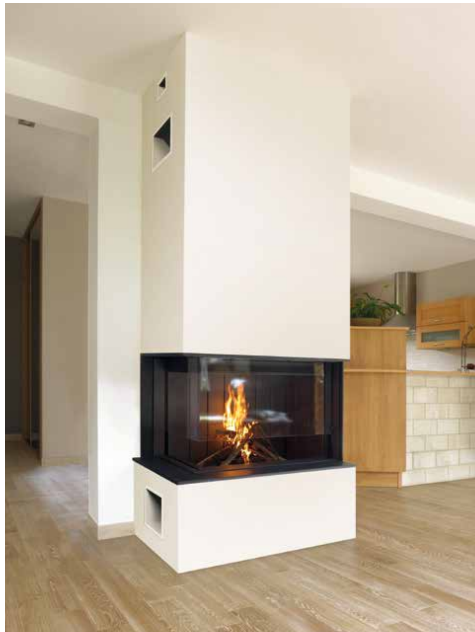
2 x S01809 + 4 x S02222