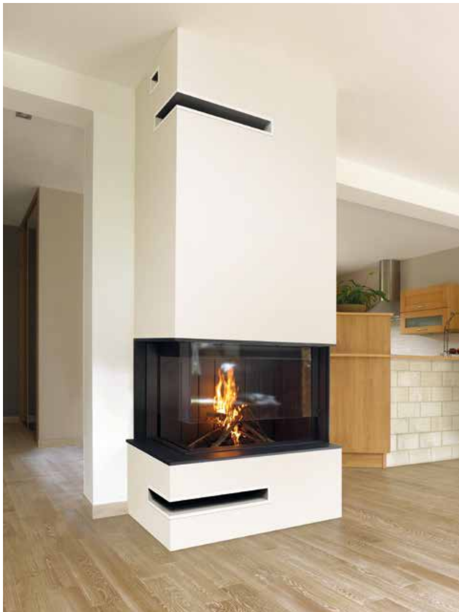
2 x S01809 + 1 x S07030AG (haut de hotte) + 1 x S07030AD retournée (bas de hotte)