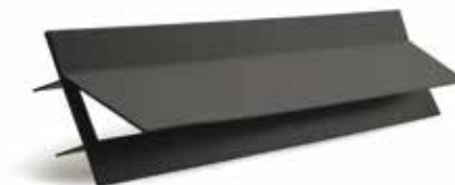
VISION 700 noir