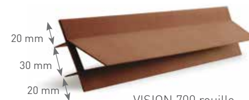
VISION 700 rouille